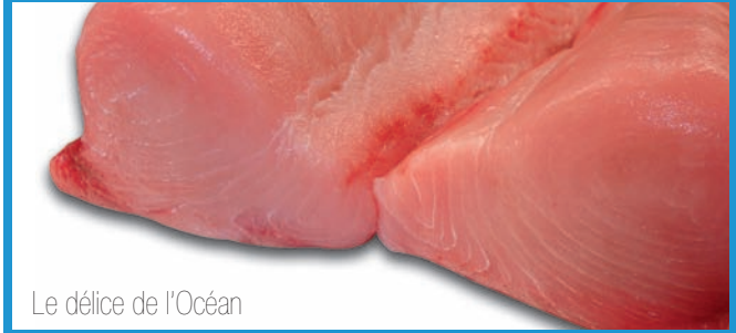
Le délice de l'Océan