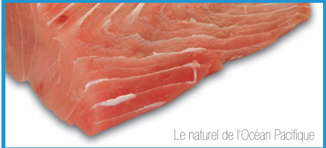
Le naturel de l'Océan Pacifique